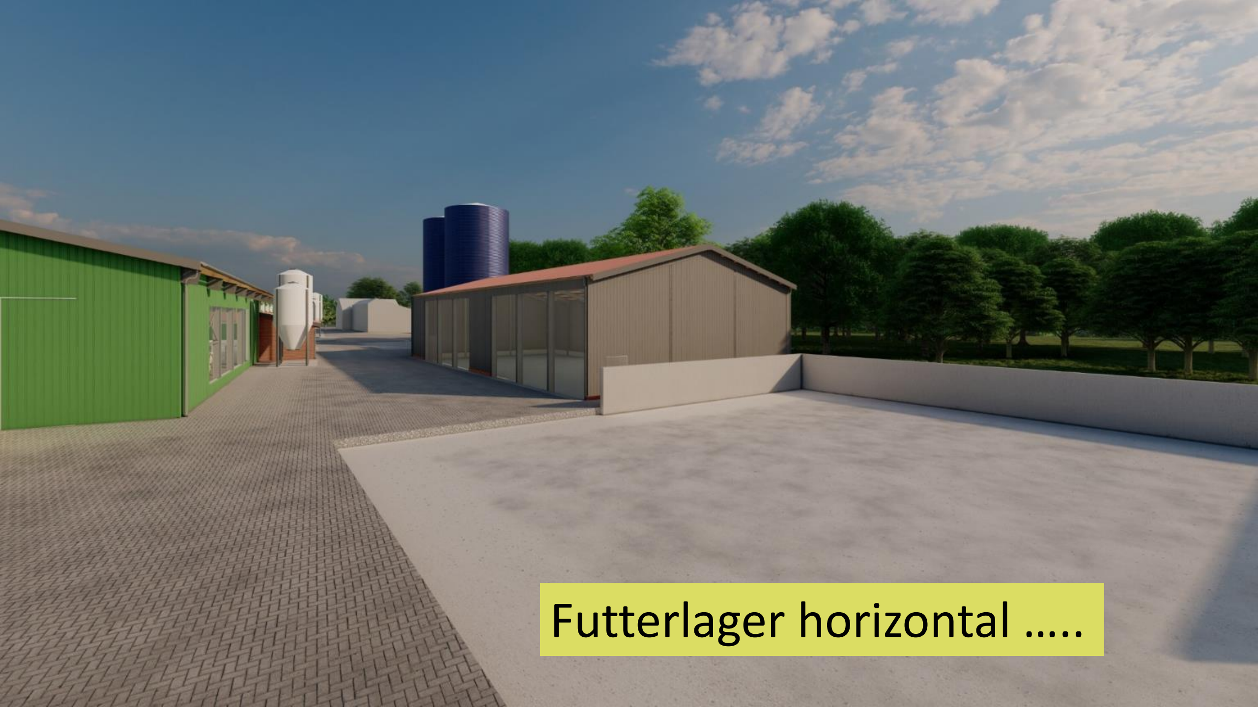
Futterlager horizontal .....